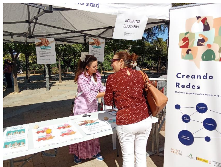
Nuestro equipo en la Feria Alma Hispana, acercando la acción social y el voluntariado a la comunidad (11 y 12 de octubre de 2025).

A lo largo de 2025, nuestra participación se ha centrado en: